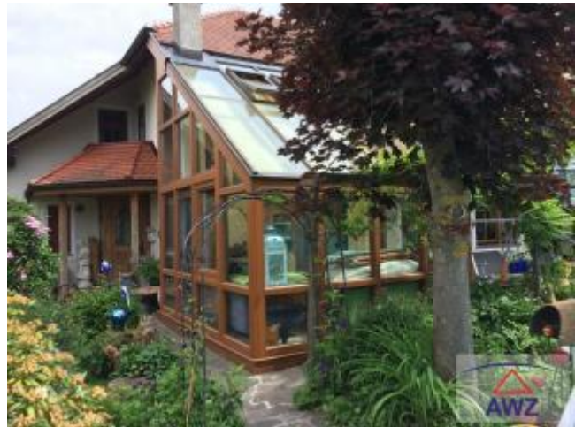
Terrasse zum Pool