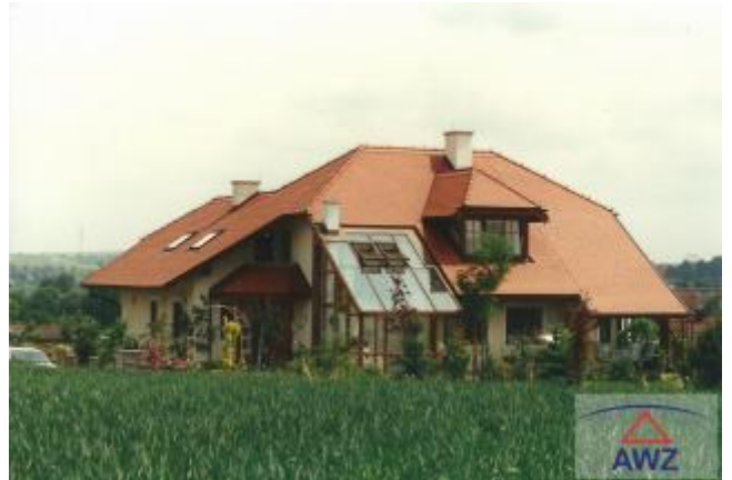
Terrasse mit Pool